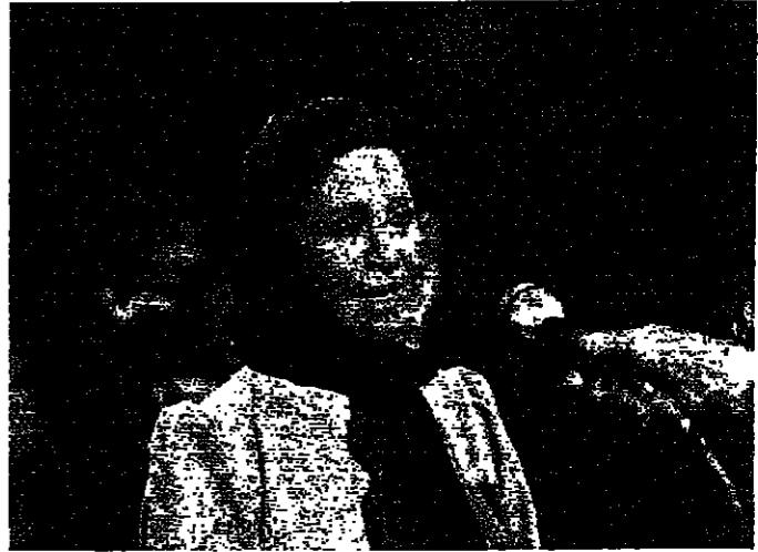
معلق حملة، الحضور النضار في جولة في الصالات تلمس مراوحة اليربوعه